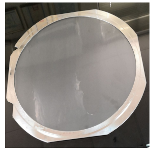
PVC UV 切割膠帶